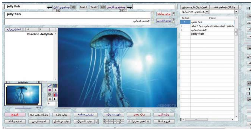
شکل ۶- نمایش تصویر در گنج‌واژه

در این برنامه، همچنین کتابخانه‌ای برای دستیابی به اطلاعات کتاب‌نگاشتی منابع و جلوگیری از ورود اطلاعات تکراری طراحی شده است، که از طریق آن، جست‌وجو در عنوان و نویسنده و سال نشر منابع ممکن شده است.