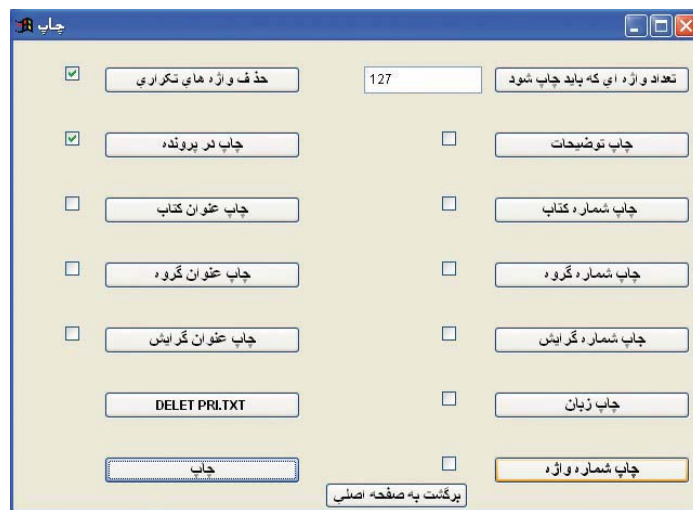
شکل ۲- انتخاب گزینه مورد نظر برای چاپ واژه/ واژه‌ها

همچنین، می‌توان معادل فارسی را همراه با اطلاعات مربوط به آن (مانند حوزه، گروه، زبان، منبع) در نمایشگر رؤیت کرد؛ به پرونده یا چاپگر فرستاد؛ یا به واژه‌پرداز ورد (Word) یا صفحه‌گسترده اکسل (Excel) انتقال داد. در هنگام چاپ، با انتخاب گزینه یا گزینه‌های دلخواه در این برنامه، اطلاعات بازیابی شده را می‌توان به صورت واحد یا گروهی به چاپگر ارسال کرد. ۱