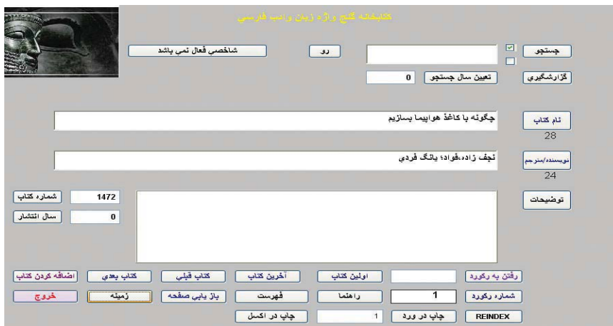
شکل ۷- پنجره اطلاعات کتاب‌نگاشتی منابع گنج‌واژه (کتابخانه)

در این برنامه، همچنین کتابخانه‌ای برای دستیابی به اطلاعات کتاب‌نگاشتی منابع و جلوگیری از ورود اطلاعات تکراری طراحی شده است، که از طریق آن، جست‌وجو در عنوان و نویسنده و سال نشر منابع ممکن شده است.